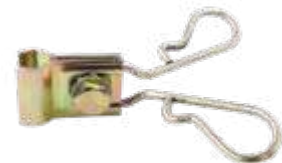
Suporte para extensão flexível compr. 68mm (duplo) - fixação na válvula (roda raida)