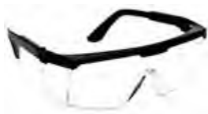
Óculos de segurança ajustável