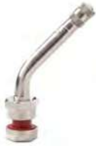
Válvula p/ pneu s/ câmara caminhões e ônibus cromada compr. 49,3mm 45°