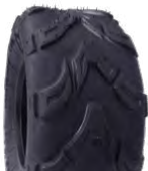
Pneu aro 10* 20x10-10 quadriciclo