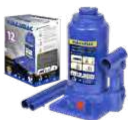
Garrafa 12t alt. 210X395mm c/ dispositivo de segurança - 1 estágio