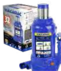
Garrafa 32T. alt. 255X405mm c/ dispositivo de segurança - 1 estágio