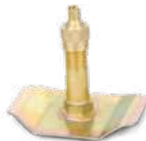
Válvula jumbo atarraxante p/ câmara de ar compr. 48,5mm reta (3881)