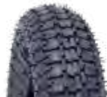
Pneu aro 08 * 3.50-8 - industrial