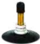
Válvula c/ base de borracha p/ câmara de ar de motos