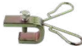
Suporte para extensão flexível compr. 68mm (duplo) - fixação na roda a disco