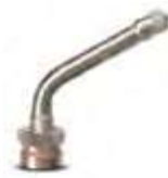
Válvula p/ pneu s/ câmara caminhões e ônibus cromada compr. 58,7mm 60°