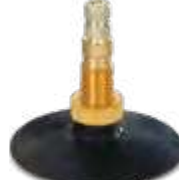
Válvula c/ base de borracha p/ câmaras de ar trator tipo ar/água