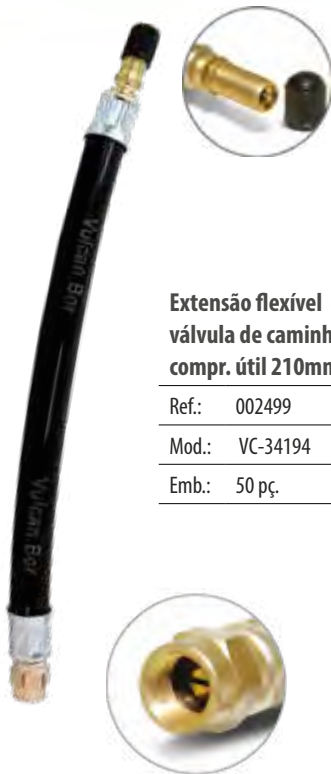
Extensão flexível de borracha p/ válvula de caminhões e ônibus compr. útil 210mm