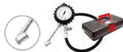
Calibrador manual c/relógio p/ pneus de autos, caminhões e ônibus (0 a 170 lbs)

Ref.: 004838 Mod.: SUPER AIR Emb.: 1 pç.