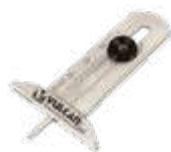
Medidor de desgaste da banda de rodagem compr. 50mm aço inox