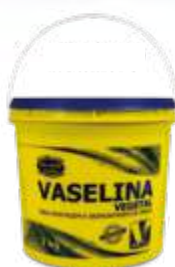
Vaseline sólida vegetal balde com 3,0kg