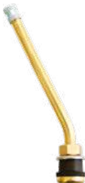
Válvula p/ pneu s/ câmara caminhões e ônibus (roda raiada) compr. 95,3mm 31°