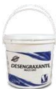
Desengraxante multi-uso balde c/ 2,6kg