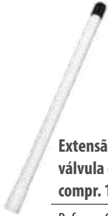
Extensão rígida em nylon p/ válvula de caminhões e ônibus compr. 170,0mm