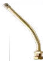
Válvula p/ pneu s/ câmara caminhões e ônibus (roda disco) compr. 135mm 27° E 43°