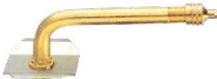
Válvula jumbo atarraxante p/ câmara de ar compr. 105mm 88° (3974)