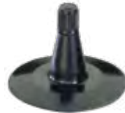
Válvula c/ base de borracha p/ câmaras de ar automóvel e agrícola