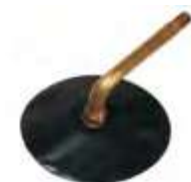
Válvula c/ base de borracha p/ caminhões e ônibus compr. 76mm base Ø82mm