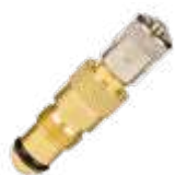
Invólucro (pivot) p/ válvula tipo ar/água