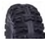
Pneu aro 04 * 4.10-4 - industrial