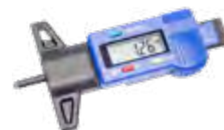
Medidor de desgaste da banda de rodagem digital compr. 86,2mm