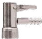
Inflador auto-travante s/ retenção c/ presilha (trava metálica) espigão Ø 1/4\"