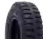
Pneu aro 04 p/ maca e cadeira de rodas 2.50-4 c/ 2 lonas