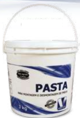
Pasta para montagem de pneus balde com 3,0kg