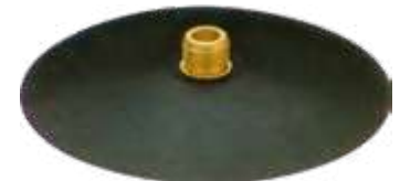
Base de borracha spud p/ válvula atarraxante tipo jumbo e socorro