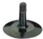
Válvula c/ base de borracha p/ câmaras de ar automóvel