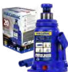
Garrafa 20T alt. 235X440mm c/ dispositivo de segurança - 1 estágio