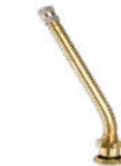
Válvula p/ pneu s/ câmara caminhões e ônibus (roda disco) compr. 110mm 27°