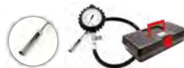
Calibrador manual c/relógio p/ pneus de veículos com rodoar (0 a 170 lbs)

Ref.: 004157 Mod.: VC-CALREL-AGRICOLA Emb.: 1 pç.