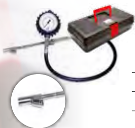
Calibrador manual c/ relógio p/ pneus de veículos com e sem rodoar (0 a 170 lbs)

Ref.: 003724 Mod.: VC-CALREL-CSRODOAR Emb.: 1 pç.