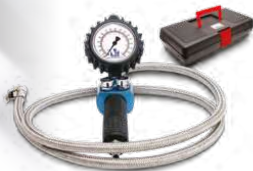
Calibrador inflador c/relógio p/aferir e inflar pneus de automóveis, caminhões e ônibus (0 a 170 lbs)

Ref.: 004838 Mod.: SUPER AIR Emb.: 1 pç.