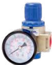
Regulador de pressão 1/4"