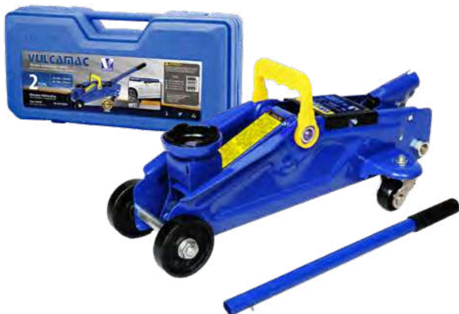
Jacaré 02T. (portátil) alt. 135X320mm (6,5kg) compr. 520X188x148mm c/maleta plástica