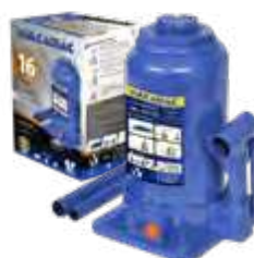
Garrafa 16T. alt. 255X425mm c/ dispositivo de segurança - 1 estágio