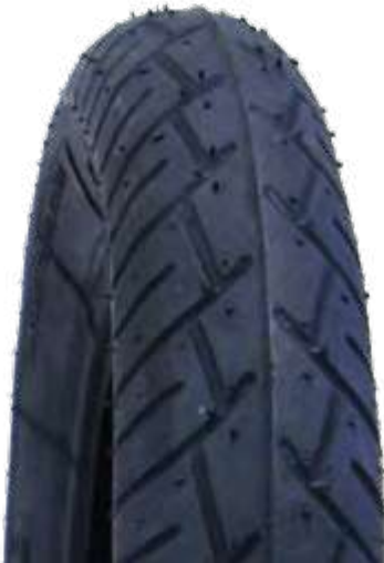
Pneu aro 08 * 3.25-8 - Industrial