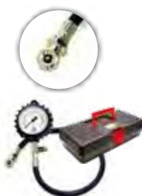
Calibrador manual c/ relógio p/ pneus de tratores ar/água (0 a 100 lbs)

Ref.: 003724 Mod.: VC-CALREL-CSRODOAR Emb.: 1 pç.