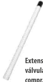
Extensão rígida em nylon p/ válvula de caminhões e ônibus compr. 164,0mm