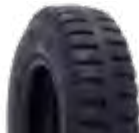
Pneu aro 08 * 200x50 - p/ maca e cadeira de rodas