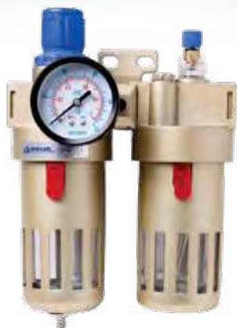
Unidade para preparação de ar 1/4" conj. lubrefil c/ copo de proteção