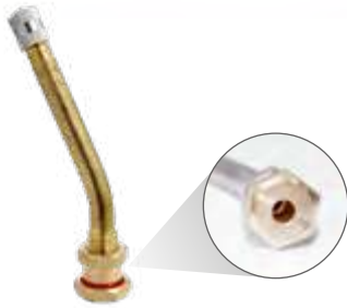
Válvula p/ pneu s/ câmara caminhões e ônibus (roda disco) compr. 85mm 27°