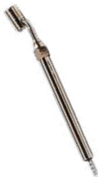
Calibrador manual p/ pneus jumbo (com cabeça giratória) (10 a 150 lbs)

Haste metálica chata, com numeral em baixo relevo.