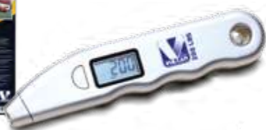
Calibrador digital graduado para automóveis, caminhões e ônibus (0 a 200 lbs)