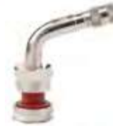
Válvula p/ pneu s/ câmara caminhões e ônibus cromada compr. 35mm 60°