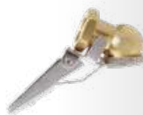
Inflador auto-travante tipo bola c/ retenção espigão Ø 1/4\"