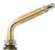
Válvula p/ pneu agrícola s/ câmara tipo ar/água compr. 114,8mm 65° (5884)