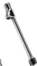
Inflador com bocal duplo c/ retenção - rosca fêmea Ø 1/4\"