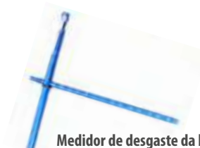
Medidor de desgaste da banda de rodagem p/ veículos fora de estrada e agrícola