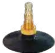
Válvula c/ base de borracha p/ câmaras de ar trator tipo ar/água