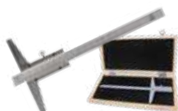
Medidor de desgaste da banda de rodagem p/ veículos fora de estrada e agrícola