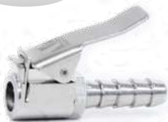
Inflador auto-travante s/ retenção modelo europeu espigão Ø 5/16\"

Recomendado para Calibradores Eletrônicos