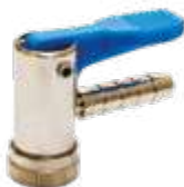
Inflador auto-travante s/ retenção c/ presilha (trava plástica) espigão Ø 1/4\"