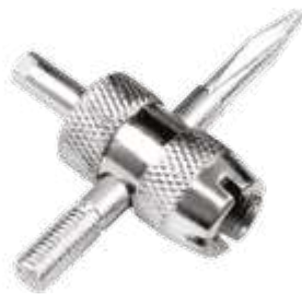
Tarraxa 4x1 com rosca esquerda compr. 29,7mm