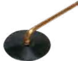
Válvula c/ base de borracha p/ caminhões e ônibus compr. 129mm base Ø82mm