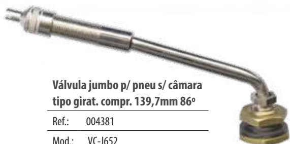
Válvula jumbo p/ pneu s/ câmara tipo girat. compr. 139,7mm 86°