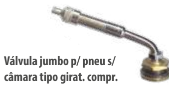
Válvula jumbo p/ pneu s/ câmara tipo girat. compr. 79,5mm 74°