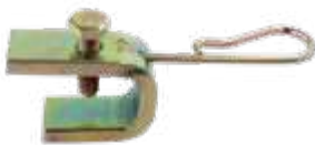
Suporte para extensão flexível compr. 82mm (simples) - fixação na roda a disco