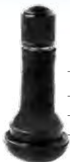
Válvula p/ pneu s/ câmara automóveis compr. 49,1mm Ø 11,5mm