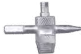
Tarraxa 4 x 1 jumbo compr. 46mm