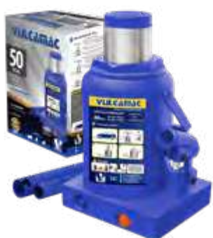
Garrafa 50T alt. 260X415mm c/ dispositivo de segurança - 1 estágio