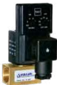
Purgador eletrônico 1/2" 2/2 vias 220vca