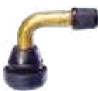
Válvula p/ pneu s/ câmara de ar para moto scooter Ø 11,5mm