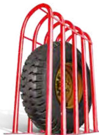
Grade de segurança para pneus de carga com 5 barras de 2" (1,30m x 0,81m x 0,40m)