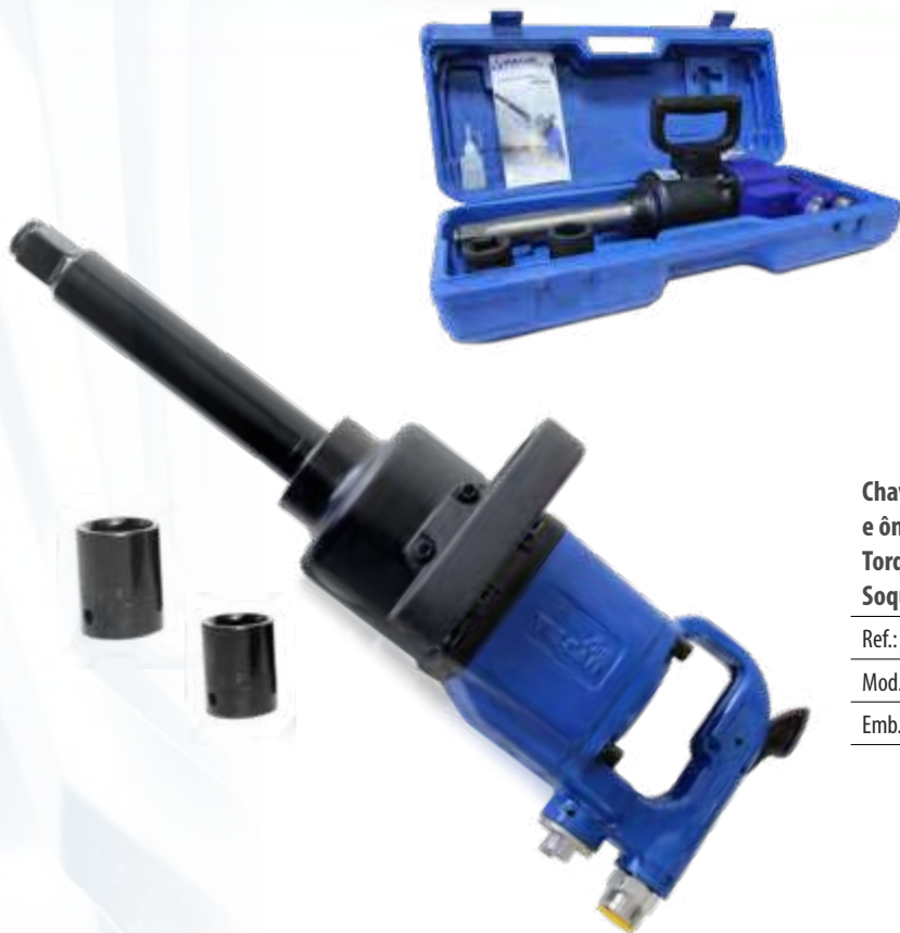
Chave de impacto industrial p/ caminhões e ônibus 1" - eixo longo c/ kit de soquetes - Torque 2600 Nm Soquetes: 32 e 36 mm