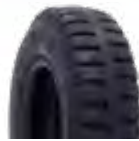
Pneu aro 04 * 2.50-4 p/ maca e cadeira de rodas