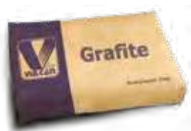
Grafite em sacas com 25kg - grafite 82140