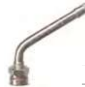
Válvula p/ pneu s/ câmara caminhões e ônibus cromada compr. 72,6mm 60°