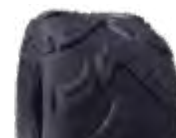
Pneu aro 06 * 145/70-6 - quadriciclo