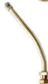
Válvula p/ pneu s/ câmara caminhões e ônibus (roda disco) compr. 181 mm 27°