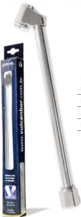
Inflador com bocal duplo c/ retenção rosca fêmea Ø 1/4\"