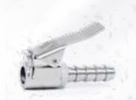
Inflador auto-travante c/ retenção modelo europeu espigão Ø 5/16\"