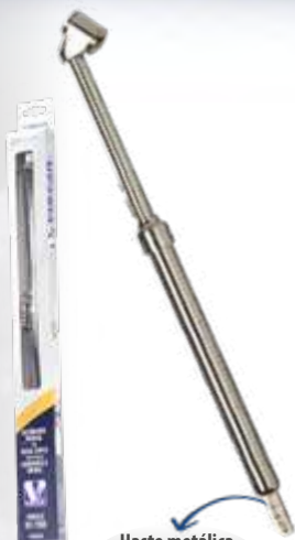
Calibrador manual c/ bocal duplo p/ pneus de caminhões e ônibus (10 a 150 lbs)