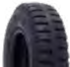
Pneu aro 04 * 3.00-4 - borrachudo