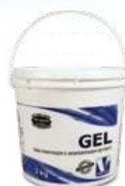
Gel para montagem de pneus balde c/ 3,0kg