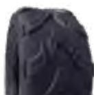
Pneu aro 07 * 16/8-7 - kart cross