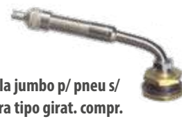
Válvula jumbo p/ pneu s/ câmara tipo girat. compr. 79,4mm 80°