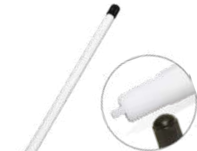
Extensão rígida em nylon p/ válvula de caminhões e ônibus compr. 150,0mm