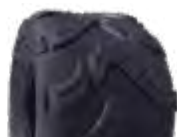
Pneu aro 08 * 18X9,50-8