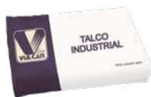
Talco industrial em sacas com 30Kg