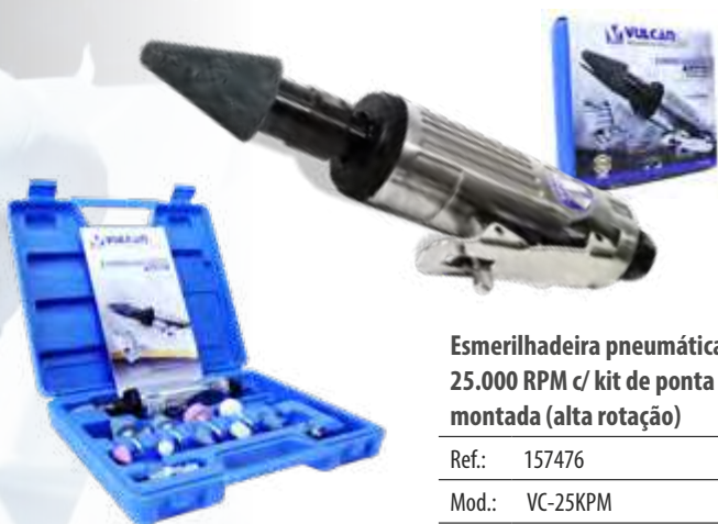
Esmerilhadeira pneumática 25.000 RPM c/ kit de ponta montada (alta rotação)