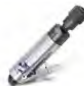
Esmerilhadeira pneumática 2.800 RPM profissional (baixa rotação)