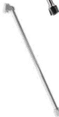
Inflador com bocal duplo c/ retenção (longo 300 mm) - rosca fêmea Ø 1/4\"