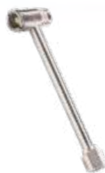
Inflador com bocal duplo c/ retenção (tipo jumbo) rosca fêmea Ø 1/4\"